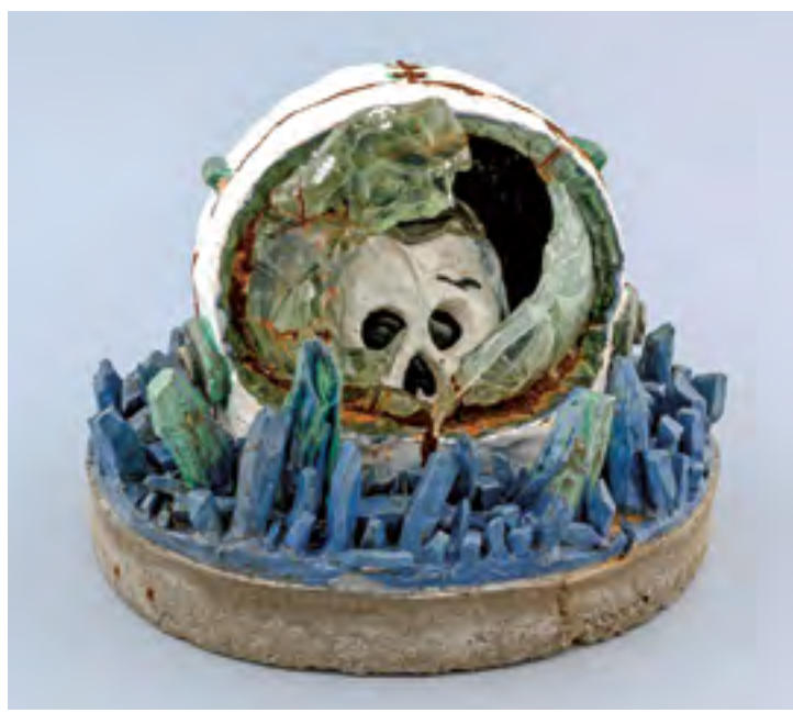
Kosmonaut, 2015, glazovaná keramika, beton, sklo, výška 35 cm