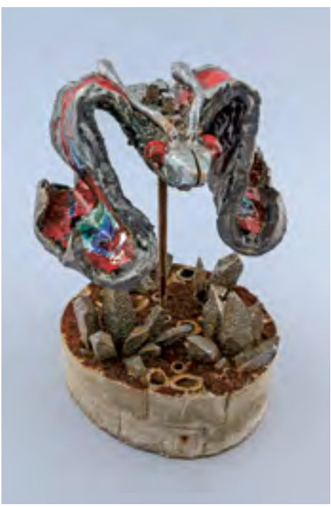
Město I, 2015, glazovaná keramika, beton, kov, výška 44 cm