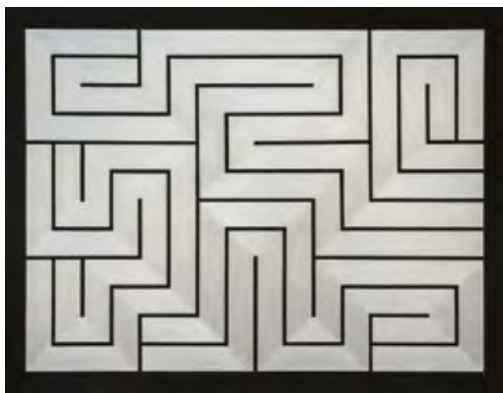
Mercurius III, 2015, kombinovaná technika, plátno, 155 x 200 cm