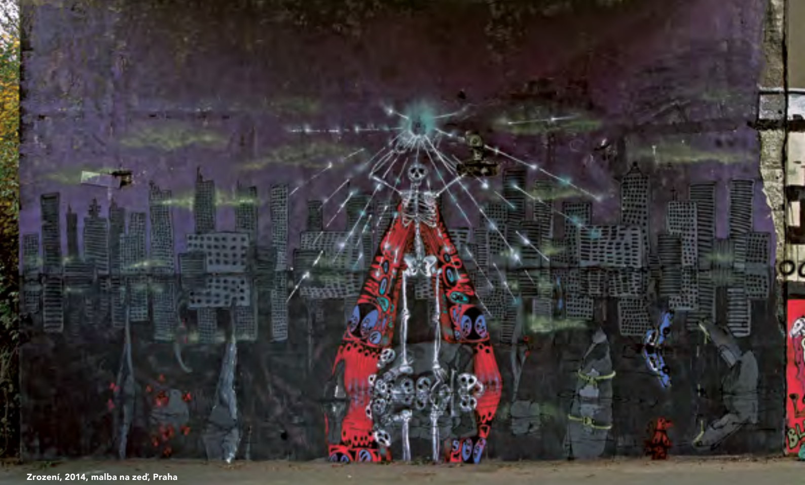
Zrození, 2014, malba na zeď, Praha