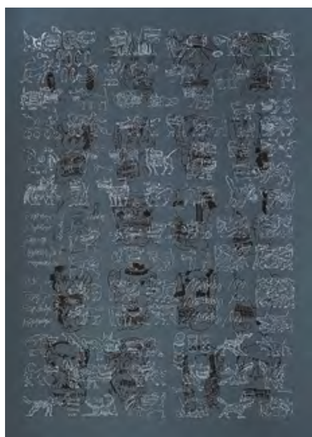
Páni psi, 2015, sítotisk, 70 x 50 cm

nit proporce, tloušťku i hustotu linek jej vedla k neustálému variování a zdokonalování. S časem přišly zručnost a jistota, ovšem vykoupené mimořádnou trpělivostí, kterou tato metoda vyžaduje. Jakmile se však nyní někde na zdi objeví OBIC, nedá se přehlédnout. Tento „vystavovaný“ projev se stává jeho nezaměnitelným poznávacím znamením. Vedle exteriérových maleb se souběžně začal věnovat i volné tvorbě, jak malbě, tak i grafice v technikách linorytu a sítotisku. Zpočátku i zde pracoval s modifikovanými fragmenty grafemů svého jména, později však na rozdíl od venkovních realizací od písma upustil a linie používá čistě jako formální prvky. Střídá negativní či pozitivní řešení, zkoumá samotný malířský podklad, způsob nanášení jednotlivých vrstev, hustotu a množství nátěrů, směr tahu štětce, matný či lesklý povrch... Za pomoci lomu světelných paprsků odrážejících se od různě strukturovaného povrchu dociluje kontrastu v ploše. Vedle geometrie však v jeho tvorbě existuje ještě druhá, neméně významná poloha, spojená s expresí a s figurálními náměty. Pracuje zde se seriálními řazeními motivů, kterými člení obrazový formát a groteskním pojetím odráží proměny fyzických i psychických stavů. Živou a energickou malbou tak kompenzuje strohou geometrizaci. V této poloze se dozajista projevil i vliv spolupráce s X - DOGem.