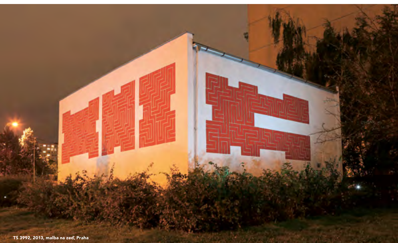
TS 3992, 2013, malba na zeď, Praha

X BOB je název výstavy a také kompilace separovaných písmen nicků dvojice protagonistů, jejichž názorová a výtvarná spřízněnost vyústila v poslední době v řadu společných realizací, především v exteriérových velkoformátových malbách. Podoba chebského projektu je ovšem založena na výtvarném přístupu nejen daleko za hranicemi tradičně vnímaného graffiti, ale i na kontrastu rozdílných poloh představujících tvorbu malířskou (OBIC) a sochařskou (X - DOG).