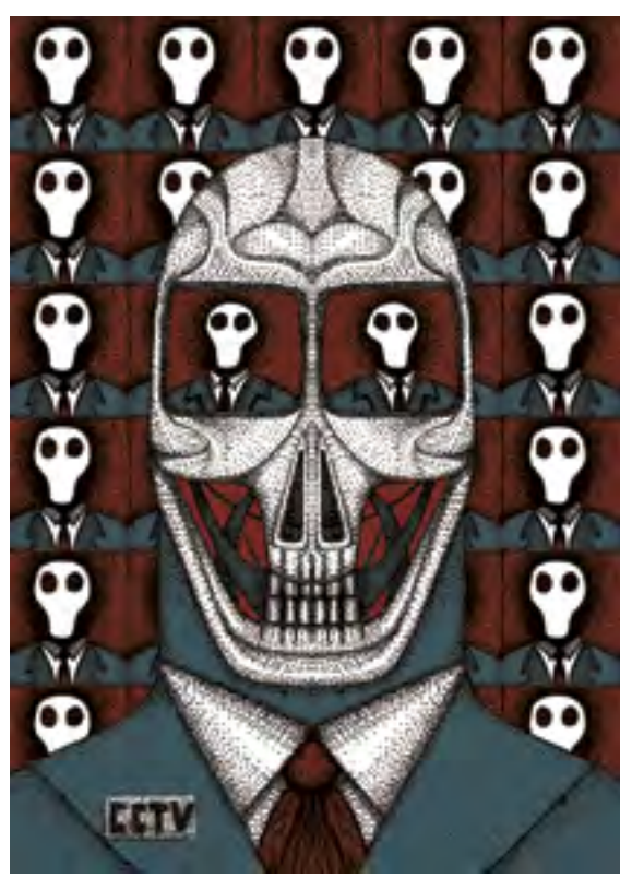
CCTV, 2014, sitotisk, papír, 700 x 500 mm

OBIC, X-DOG – X-BOB , Malá galerie, 27. 6.–23. 8. 2015, Kurátor: Jiří Gordon, Vernisáž 26. června v 17.00, Otevírací doba: út–ne, 10.00–17.00 Galerie výtvarného umění v Chebu, příspěvková organizace Karlovarského kraje, náměstí Krále Jiřího z Poděbrad 16, 350 02 Cheb T: +420 354 422 450, F: +420 354 422 163, info@gavu.cz, www.gavu.cz