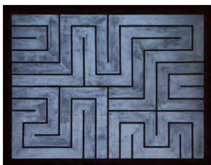
Nocturno, 2015, kombinovaná technika, plátno, 155 x 200 cm