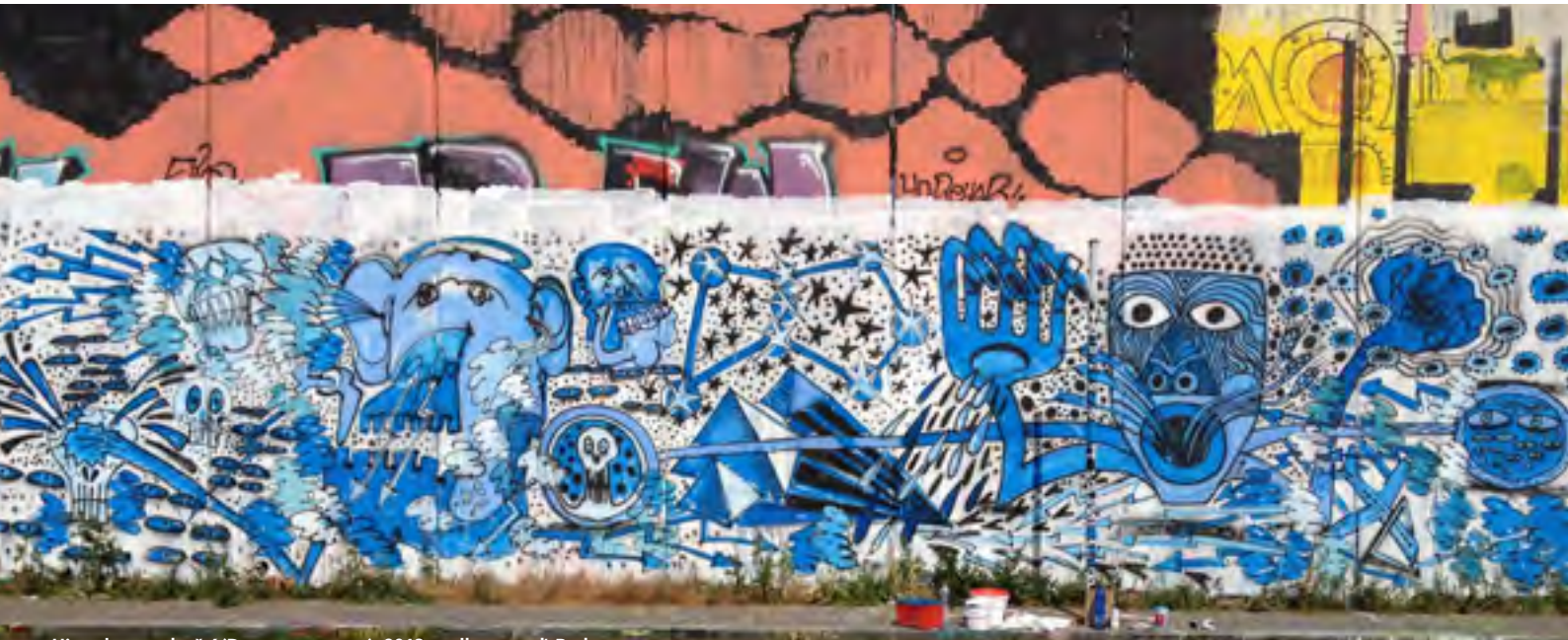
Historika z podsvětí (Downtown story), 2013, malba na zeď, Praha

OBIC, X-DOG – X-BOB , Malá galerie, 27. 6.–23. 8. 2015, Kurátor: Jiří Gordon, Vernisáž 26. června v 17.00, Otevírací doba: út–ne, 10.00–17.00 Galerie výtvarného umění v Chebu, příspěvková organizace Karlovarského kraje, náměstí Krále Jiřího z Poděbrad 16, 350 02 Cheb T: +420 354 422 450, F: +420 354 422 163, info@gavu.cz, www.gavu.cz