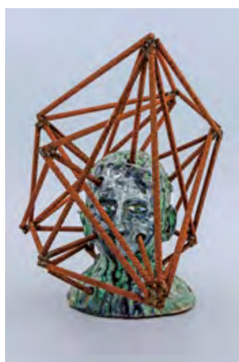
Vězení, 2015, glazovaná keramika, kov, výška 51 cm