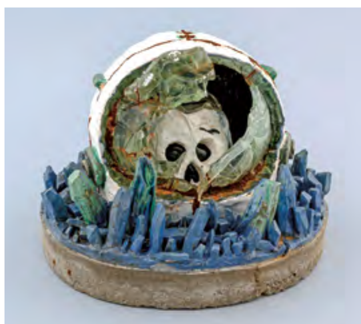
Kosmonaut, 2015, glazovaná keramika, beton, sklo, výška 35 cm