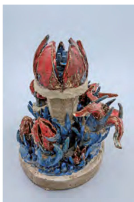
Město II, 2015, glazovaná keramika, beton, výška 46 cm