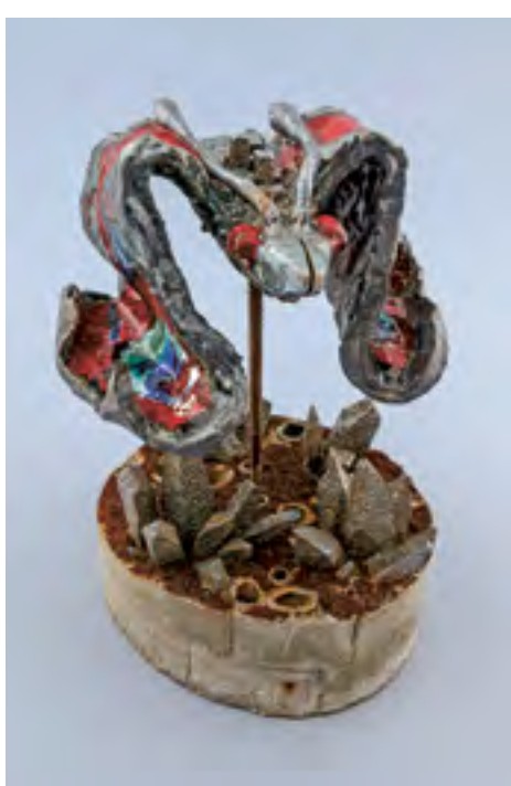
Město I, 2015, glazovaná keramika, beton, kov, výška 44 cm