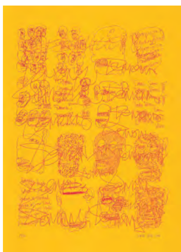
Demons, 2014, sítotisk, papír, 70 x 50 cm