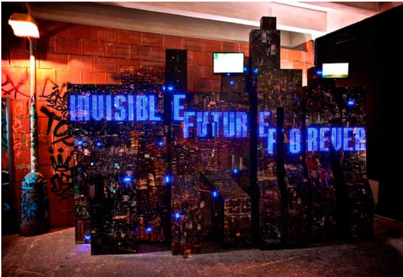
TRON, světelný objekt, 2011, 410 × 300 cm, dřevo, MDF, optická vlákna, světelné zdroje, LCD panely