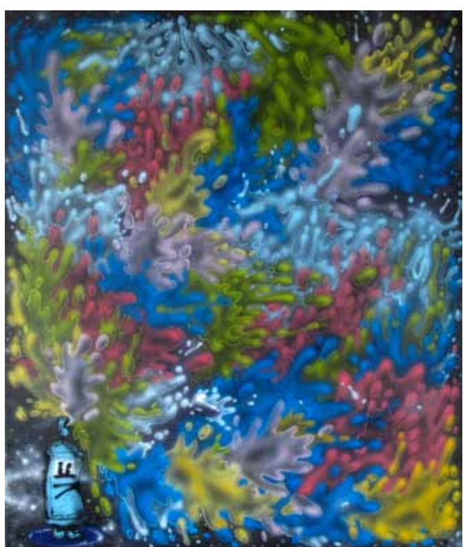
Fučík, 2011, akryl a airbrush na plátně, 100 x 120 cm

Podstatnou část výtvarné produkce Michala Škapy představuje grafika a také grafický design. Ostatně výstava plakátů a grafických listů (společně s PASTOU a POINTEM) byla i jednou z doplňkových aktivit na výstavě v galerii Source