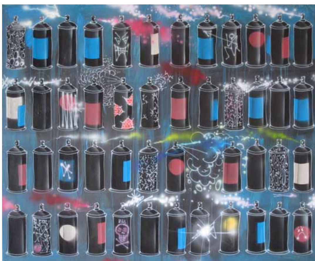
Plechovky, 2011, akryl, sprej a airbrush na plátně, 120 x 100 cm

K významným pracím z poslední doby patří rozměrná silueta svítícího města TRON - Invisible Future Forever, sestavená z různých světových mrakodrapů a doplněná projekcí městského ruchu. Představuje vizi futuristické architektury