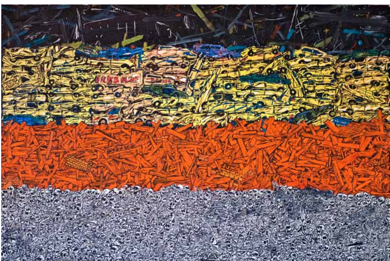
Fukušima 2, 2012, akryl, sprej a airbrush na plátně, 150 × 100 cm