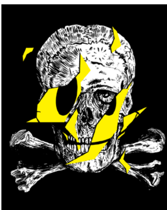
Plakát, 2011, sítotisk, 700 × 500 mm