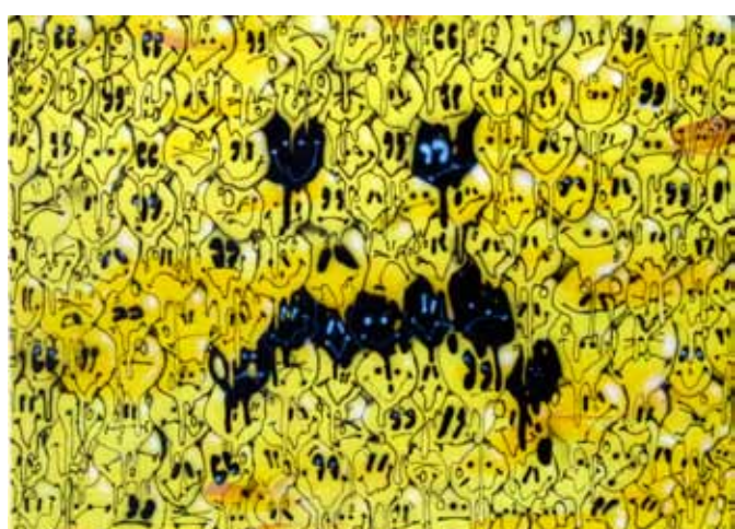
Tavení, 2010, akryl a airbrush na plátně, 70 x 50 cm