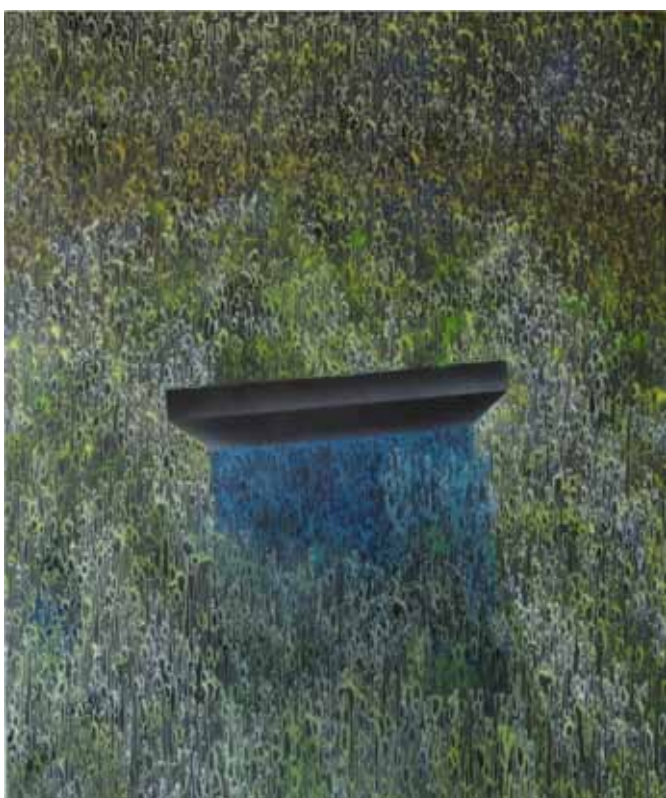
Temná hmota, 2011, akryl a airbrush na plátně, 100 × 120 cm

Podstatnou část jeho tvorby představují práce v duchu tzv. Mural Artu. Exteriérové malby můžeme spatřit např. na fasádě Centra současného umění Dox (TRON, POINT, PASTA), kde obdobně jako na stěnách ZŠ Gutova na Praze 10 (TRON, POINT, OBIC a GENOE) Škapa pracoval se svým oblíbeným motivem stylizované